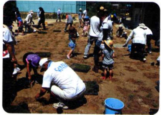
田熊保育所での苗芝移植作業

芝生が根付いた緑のグラウンドは、スポーツのほか、盆踊り大会等3世代が一緒に楽しめる交流広場になっています。