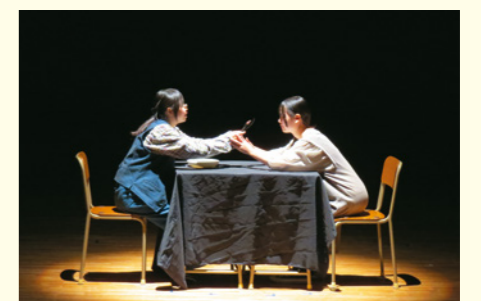
三原東高校「明日、君を食べるよ」