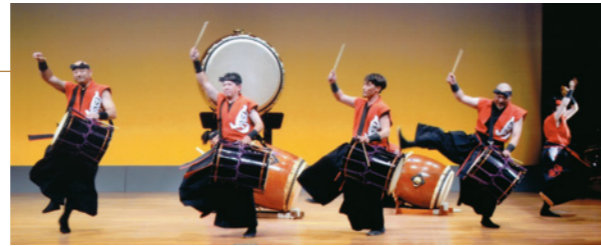
音楽芸能祭の様相(鳥衆)

また、地域の関係団体によるバザーも行いました。久々の開催に多数の市民の方が来場され、作品鑑賞や舞台発表を楽しんで頂きました。文化祭を通じて、各団体の研鑽と交流、地域の文化振興に取り組んで参ります。