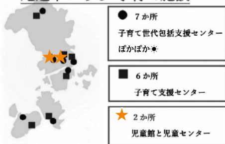
尾道市にある 子育て施設

子育て支援センター内、もしくは近くに児童館を設置すれば、赤ちゃん→未就学児→小学生とひとつの流れができて、安心して子育てができると思うが児童館や児童センターを増やしておくつもりはあるか。