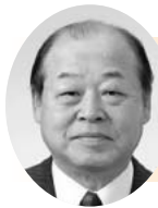
潮風おのみち いしもり けいし 石森 啓司