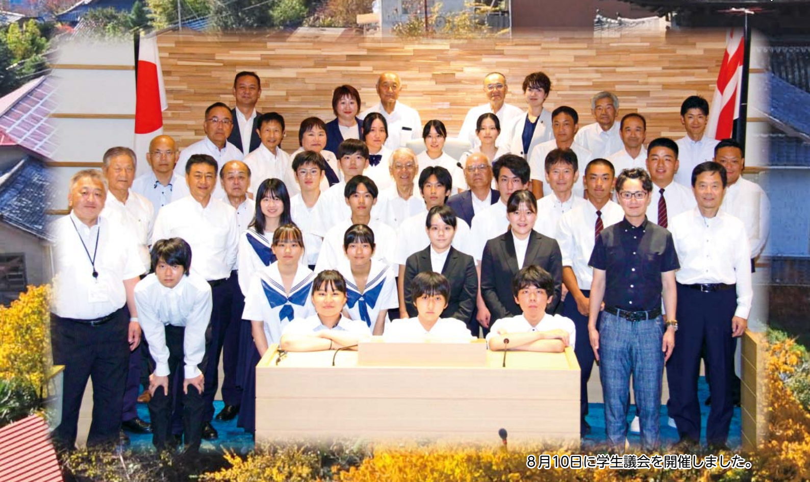
8月10日に学生議会を開催しました。