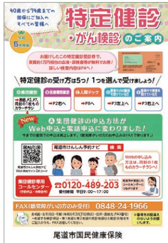
▲ 特定健診のご案内