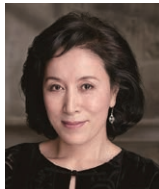
ゲスト: 高畑 淳子