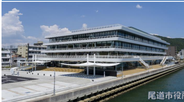
尾道市役所 本庁舎