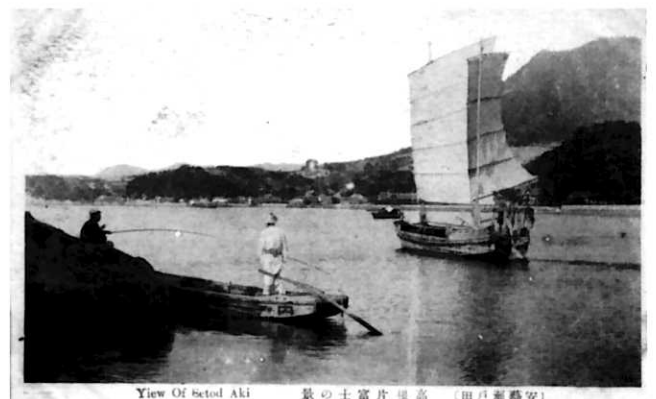
View Of Setod Aki 景の土窟片浪高（田戸瀬藝安）

江戸時代の記録「国郡志下調査出帳」には、「第一東雲陰、其外何風ニ而度風受能、船繫方宜敷能湊ニ而売船入津（第一に、東雲の陰になり、其外は、何風にても風受けが良く、従って、船の繫方は宜しく、良き湊だから、売り船が入津している）」と、風受け