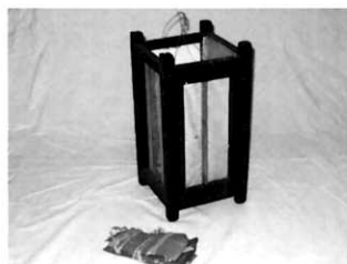
掛行灯と点火用付け木