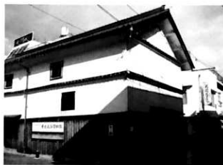
堀内家 旧塩蔵（現 尾道市瀬戸田歴史民俗資料館）