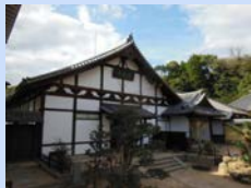
浄土寺の保存修理 （整備後）