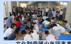
文化財愛護少年団事業