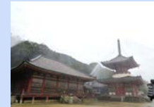
浄土寺に設置した防災設備