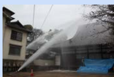
常称寺に設置した防災設備