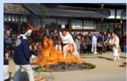
柴燈護摩(火渡り神事)