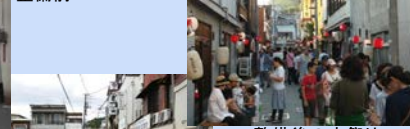
整備後の水祭りの状況