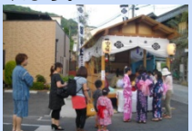
山王祭。この日から浴衣を着る風習

山脇神社の祭礼は、「山王祭」(別名「ゆかた祭り」)と呼ばれ、旧暦4月の申の日(5月末)に行われます。