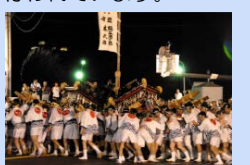
祇園祭の三体廻し

八坂神社では、毎年7月初旬、祇園祭が行われます。勇壮な三体神輿の練り歩きや三体廻しは、江戸時代から行われています。