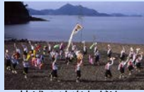
椋浦の法楽おどり(黒無形民俗文化財)

因島椋浦(いんのしまむくのうら)町では、毎年8月15日の夕方、「椋浦の法楽おどり」(黒無形民俗文化財)が行われます。この他、外浦(とのうら)の法楽おどり、岩子(いわし)島蔵島神社管絃祭(民俗文化財)、津部田五島神社の「住吉祭の曳船」(民俗文化財)などが行われています。