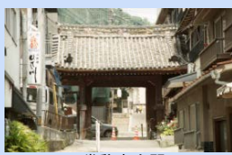
常称寺大門 （保存修理を予定）