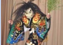
中庄十二神祇神楽(黒無形民俗文化財)

尾道では、各地の神社などで神楽が舞われ、大きく分けると、芸者諸島に分布する神楽と山間部に分布する備後神楽があげられます。